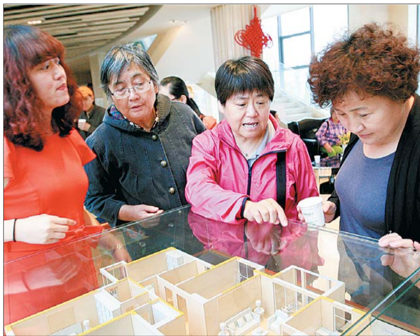
读者仔细研究房型。

本报组织的看海景房活动不仅仅是看海景房，还有看大海美景的环节。“落霞与孤鹜齐飞”、“碧海青天”、“海天一色”，种种美丽的词