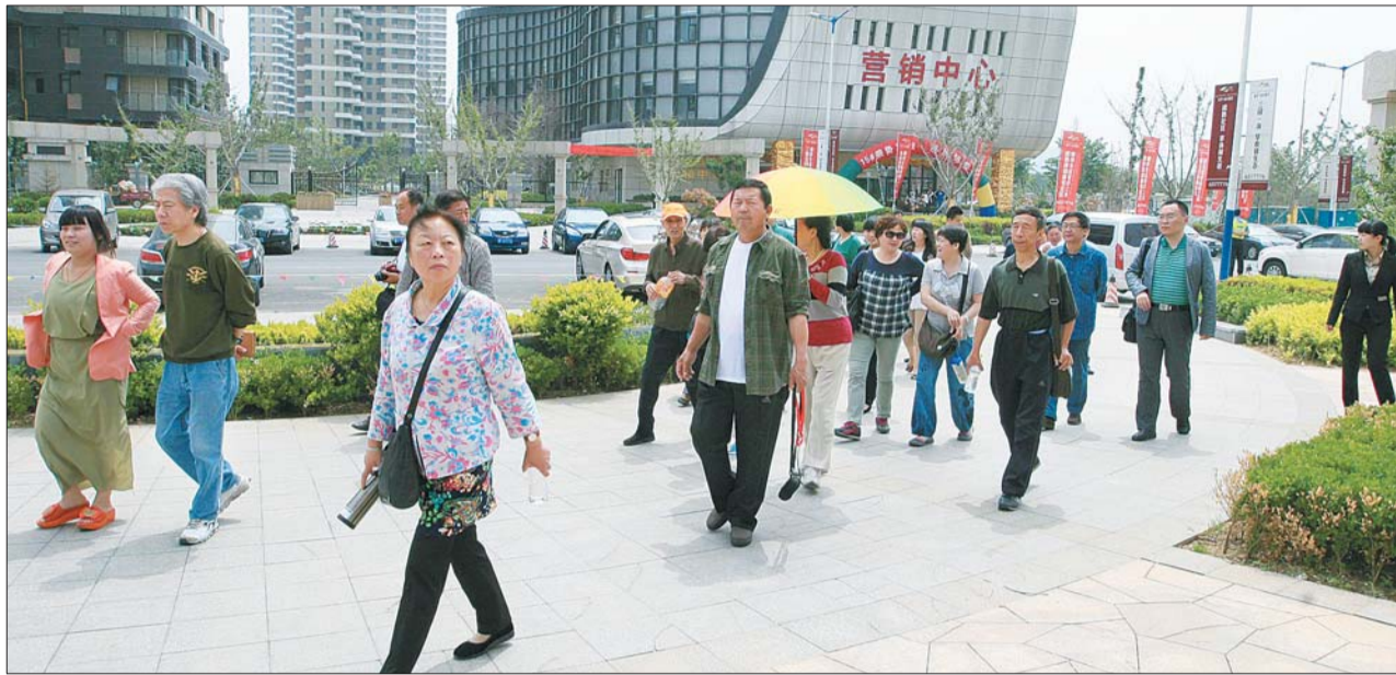
读者兴致勃勃实地参观楼盘。