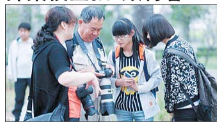
摄友们在交流摄影技巧。

24日上午，山东大学洪楼校区，摄影爱好者们将镜头对准“即将离校的大学生”，本报读者俱乐部摄友会举办的“致青春”大学校园拍摄活动当天在山大校园举行。