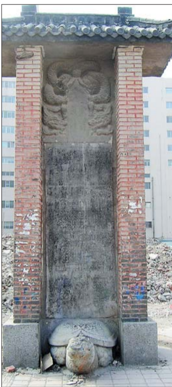
济南舜井街现存迎祥宫碑

张养浩(1270~1329),字希孟,号云庄,济南人。散曲大家张养浩,亦通八法,能抗时彦,元时既奉其书为帖,如,元代王礼《麟原文集·前集》卷十有《跋张养浩示初科诸进士免帖》。张养浩书名被其他成就所掩,存世书作亦鲜。至治元年(1321)后,张养浩辞官蛰居故里八年,其书法遗迹,在济南一带尚有可寻。