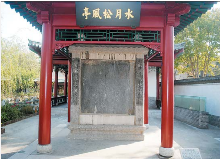
▲桓台忠勤祠现存水月松风石屏