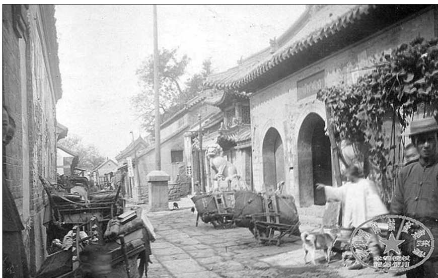
▲1908年,将军庙街府城隍庙。