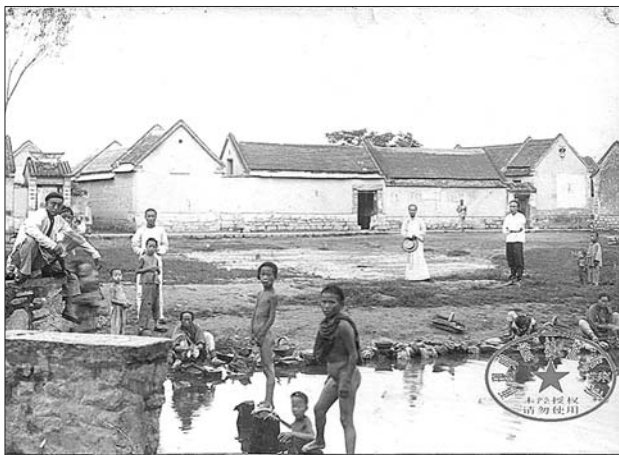
▲1908年,济南某街区泉边的市井生活。(镜头一)