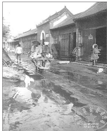
▲1908年,济南某街上的独轮车。(镜头二)