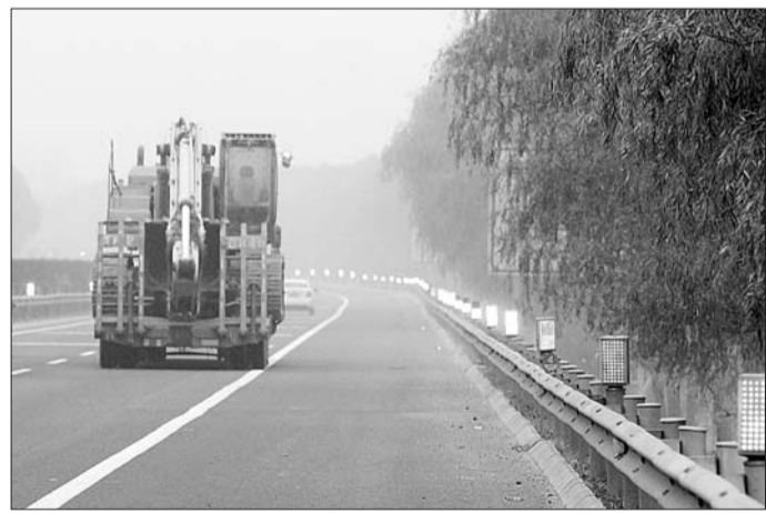
雾天防撞系统可有效降低事故发生率。

这套预警系统如何工作呢?原来,预警灯是成对、对称性安装在中间护栏和路边的防撞栏上,一个断面安装四个预警灯,这四个灯构成一个灯组。对称的两个预警灯通过发射孔不断相互发射、接受红外线信号,当有车辆经过时信号被车辆