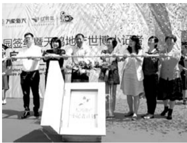
选拔活动，自2012始，历经伦敦奥运会、风情西班牙、新西兰澳大利亚，已进行

2015年米兰世博会小记者招募启动仪式，也同步举行。此次活动是由意大利驻华使馆、北京青年报、北京学通社、齐鲁童星网联合举办，并由天鸿地产全程赞助。天鸿地产赞助的小记者的