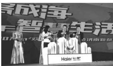
海尔·云世界傲踞主城中央核心，800万平米巨制，划疆泉城特色风貌轴心大明湖畔，北接济南商贸、人文核心源地小清河，涵盖主题游乐、云商业、云办公、U-home智慧人居、人文体验等全业态于一体的城市标志性复合功能区，一站式名校教育，五维立体交通网，泉

本次发布会以“汇客成海，智慧生活”为主题，通过分析讲解、微信互动、精彩表演等多种方式，分别呈现了海尔地产、海客会及海尔·云世界的成长历程及未来规划。