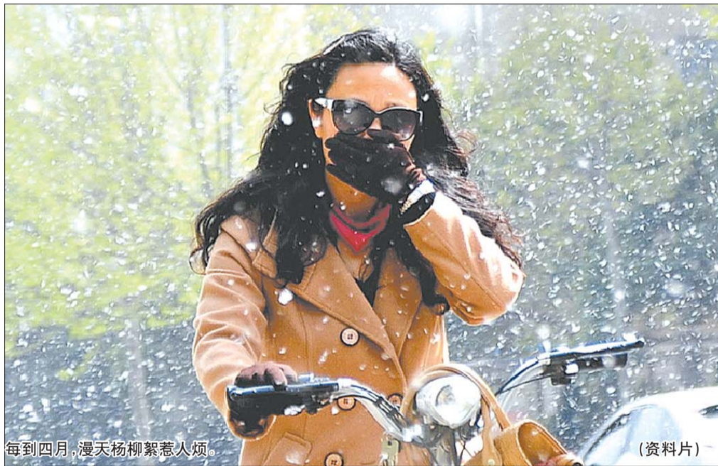
每到四月,漫天杨柳絮惹人烦。

不过在植物专家看来,说杨柳絮会引起花粉过敏,确实有点冤枉。“杨柳絮根本就不是花,是花开后结的果。虽然杨柳絮确实可能给部分易感人群带来不适,但跟花粉过敏扯不上关系。”泉城公园高级