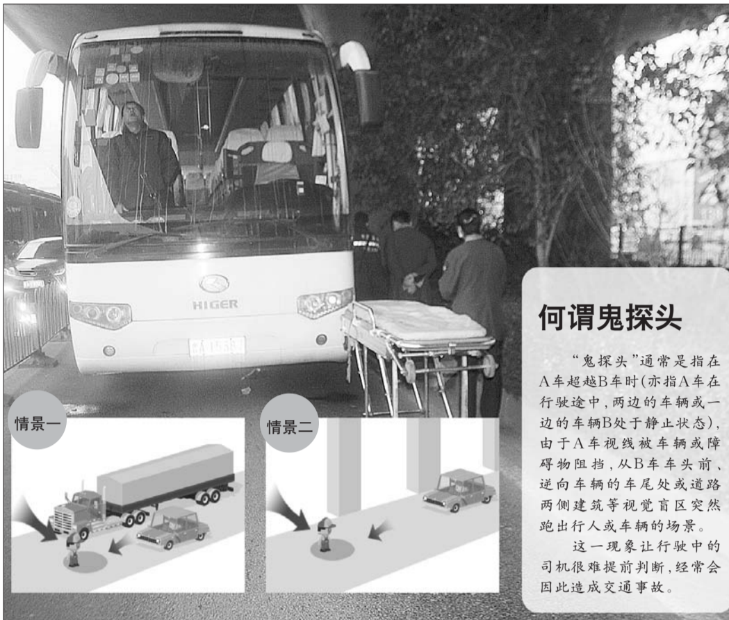
上图为北园大街BRT撞行人事故现场。

为了安全起见,目前天桥园林部门决定,将在2天之内将北园大街北园高架下的铁丝网全都修好。