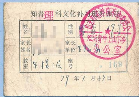
1979年的知青理科文化补习班听课证。