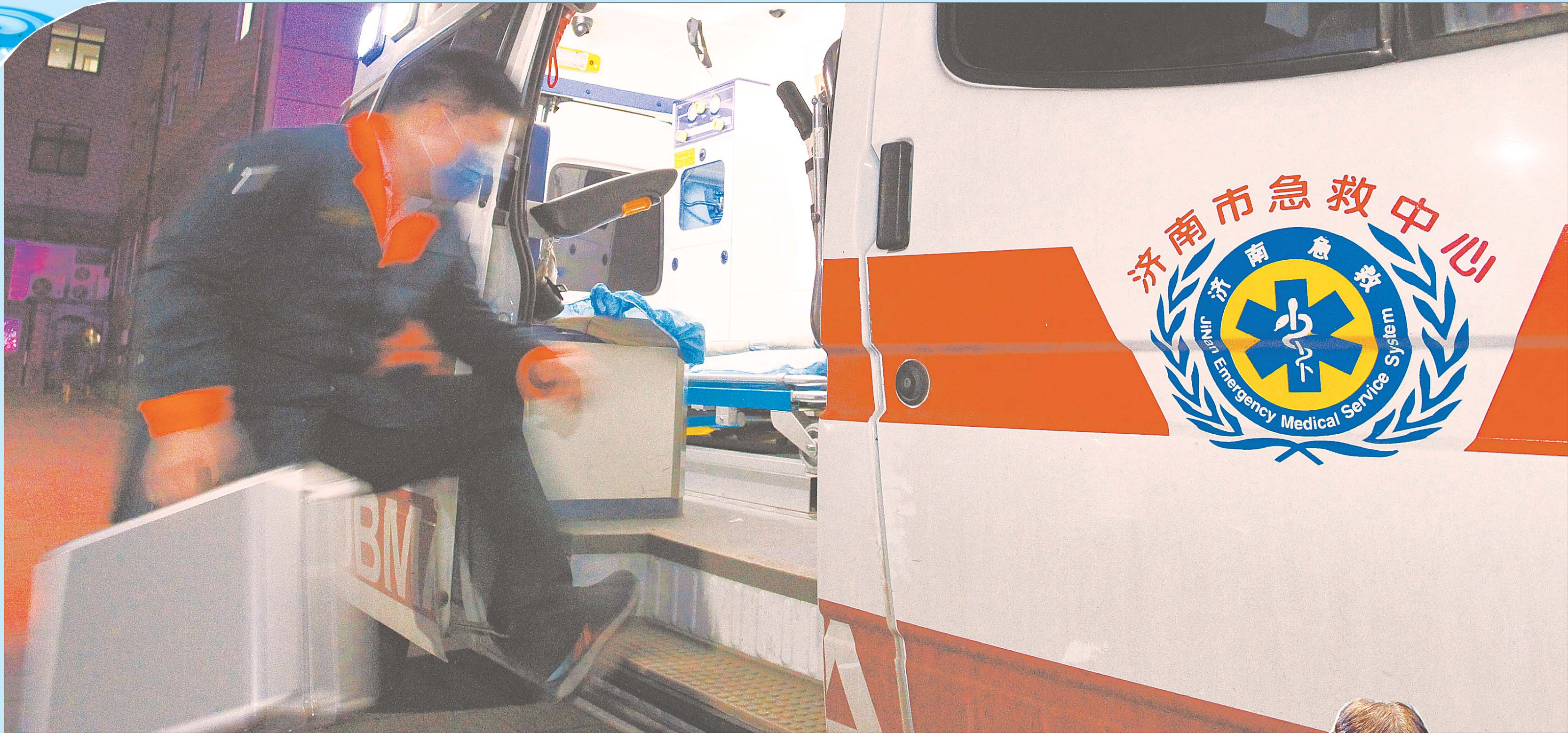
电话铃声响起，了解大致的情况后，清点检查好一切急救药品、仪器、设备，急救人员们便以最快的速度登上急救车，奔赴现场。