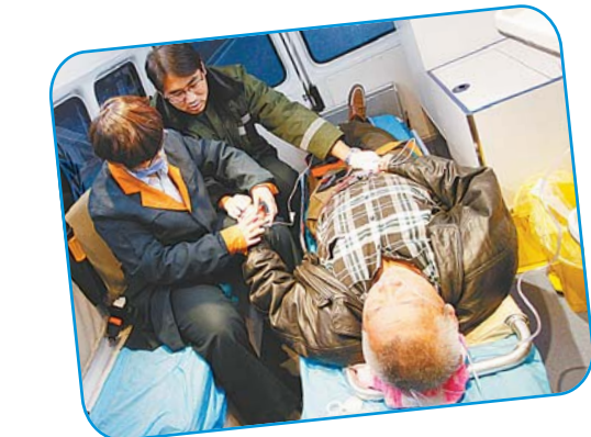
▲在救护车上，急救人员娴熟地完成一系列治疗操作，让病人得到初步救治。