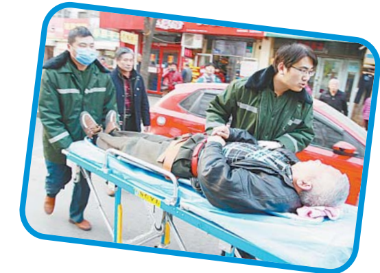
▲12月7日下午4点半，花洪路一老人突然晕倒在地。闹市之中，他们急速而稳健地推着担架车，为病人争取更多时间。