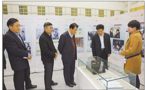
组织开展孔繁森事迹巡展活动(领导参观)