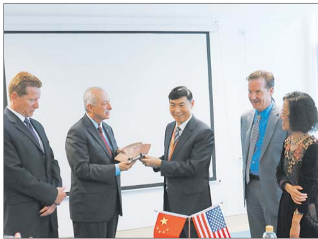
美国克瑞斯特医疗集团访问团来院参观交流