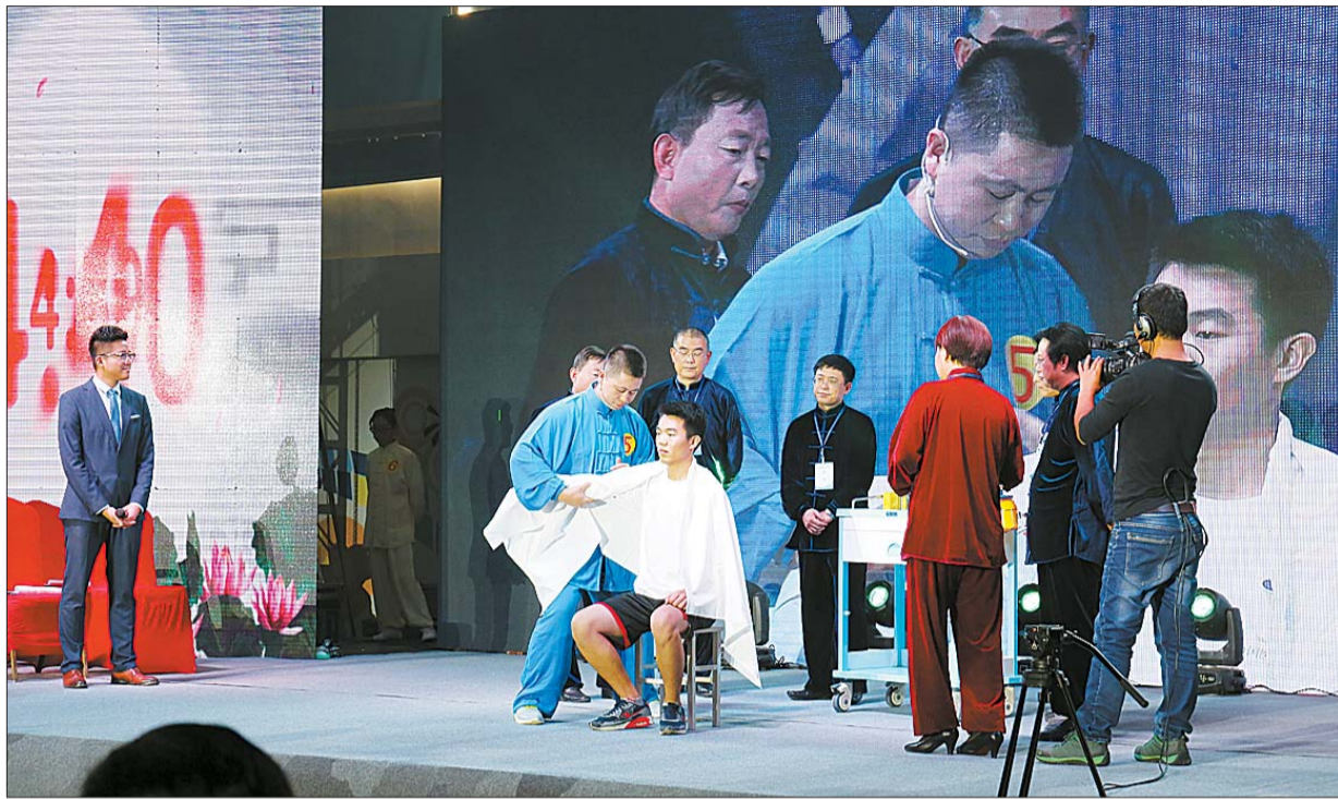
首届“国药杯”中医药传统技能大赛