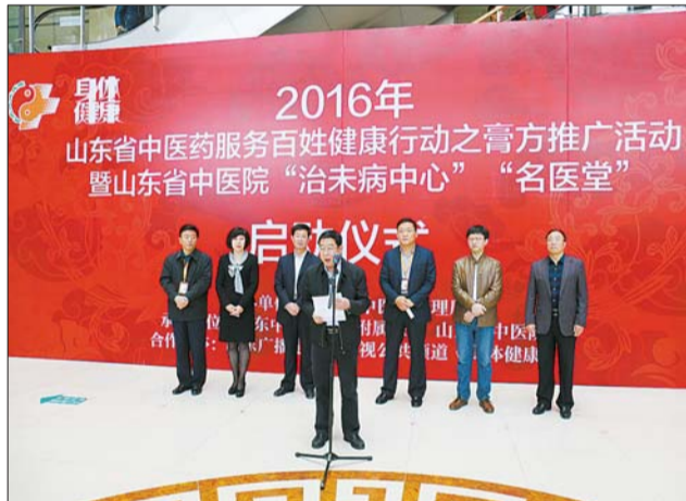
2016年山东省中医药服务百姓健康行动之膏方推广活动