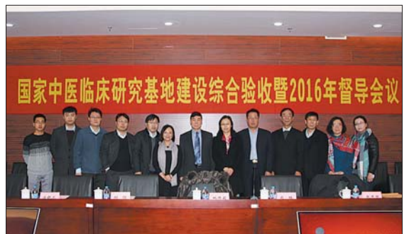
参加国家中医临床研究基地建设综合验收暨2016年督导会议