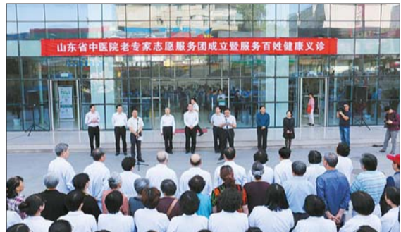
医院成立老专家志愿服务团