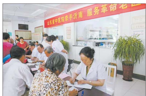
老专家志愿服务团赴革命老区开展义诊