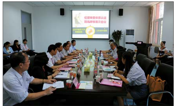
国家中医临床研究基地通过世中联伦理审查认证