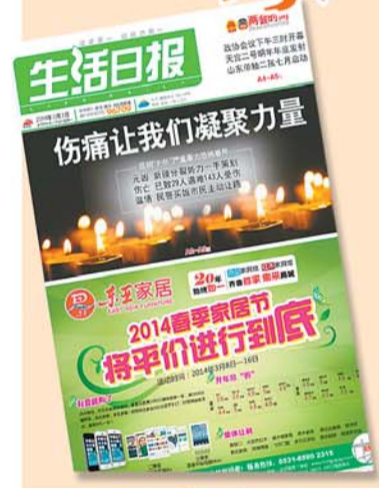
2014年3月1日，云南昆明火车站发生暴恐案件，造成31死141伤。