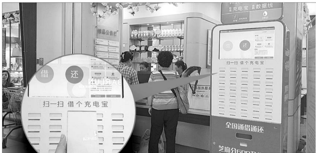
17日，记者在历山路家乐福刷出来一个充电宝。

场需求呢？深圳来电科技有限公司山东地区负责人表示，随着手机、平板等移动智能设备的普及使用，充电成为一种刚需。手机电量低，已经成为不少人最难以忍受的事。市民小王说，他每次出门时间较长都会带着充电宝以防手机没电。