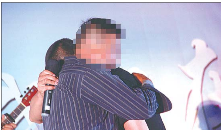
戒毒所里父子俩拥抱在一起。