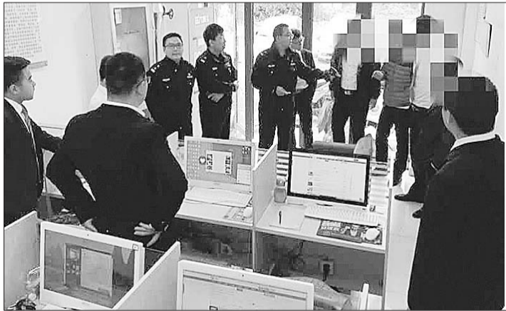
市中公安首开罚单，两家房屋中介被处罚500元。