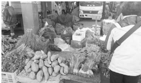
4 销售:商户持合格证和销售证卖韭菜