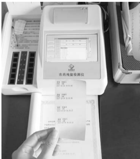
2 检测:快检仪3分钟出结果