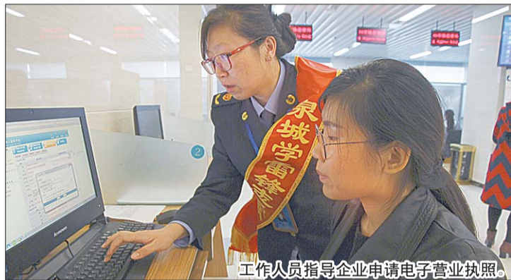
工作人员指导企业申请电子营业执照。

下区政务服务中心在增加业务办理窗口的基础上,在政务服务中心大厅北侧设立“营业执照全程电子化服务区”,广泛宣传 and 引导“网上名称自主申报”和“电子执照登记申报”办事程序。同时,组织区市场监督管理局窗口和市农行共同解决了电子签名这个技术关键,于9月15日签发了全区第一张电子营业执照,实现了全程网上电子审批“一网办理”的政务服务,截至目前,共为辖区23户企业签发了电子营业执照,位居济南市区电子营业执照发照量首位。