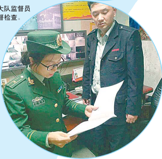
▶大队监督员 监督检查。

生活日报11月19日讯 为坚决遏制重特大火灾,尤其是群死群伤恶性火灾的发生,连日来,历下大队结合辖区消防工作实际,全面推进火灾隐患排查整治工作,奏响“检查+防范+宣传”三部曲,助力“119”消防宣传月。