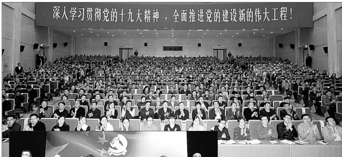
深入学习贯彻党的十九大精神，全面推进党的建设新的伟大工程！

选树先进典型是历城区落实“453”重点工作的重要举措，今年以来，该区以评选“历城实干家”为重点，在全区党员干部中大力发掘和宣传先进典型，并将各行业中的典型视为推动发展的强大动力和见证发展成果的宝贵财富，号召全区广大党员干部主动对标先进，见贤思齐，学习先进事迹，汲取榜样力量，在各自岗位不忘初心、牢记使命，攻坚克难、砥砺前行，为全区经济社会发展作出新的更大的贡献。