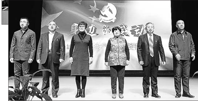
▲历城区举办“身边的感动”——优秀共产党员先进事迹报告会。