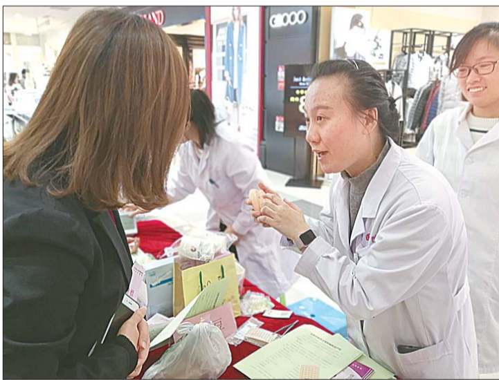
大明湖街道舜井社区联合山东省中医院为辖区白领义诊。