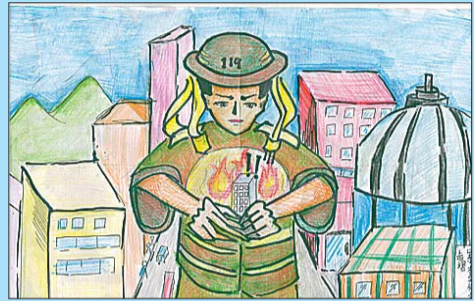
山东省实验小学 赵熠 画