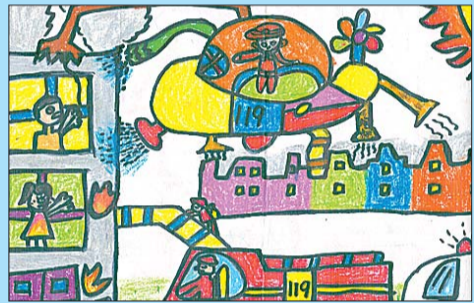
绣惠街道中心小学 郭晋滔 画