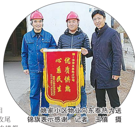
姚家小区物业向东泰热力送锦旗表示感谢。

大华紫郡A5、东城御景北区、万科新里程二期、保利华庭二期等11个小区,新增供热面积约70万平方米。同时,针对问题多多的自管站,济南东泰热力积极整改回收,新增西蒋峪和苑等18个换热站,2.5万余用户,保证了有关用户的用热质量,将集中供热的温暖送往更多百姓家中。