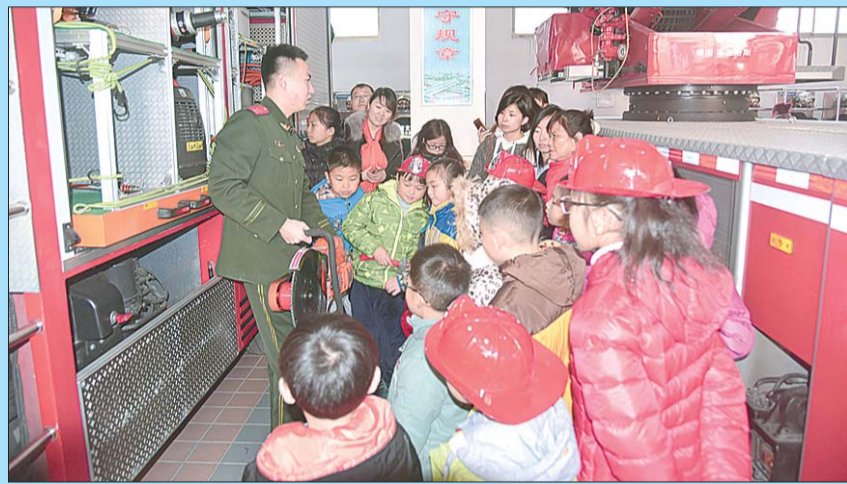
颁奖仪式后获奖者接受消防安全知识教育。