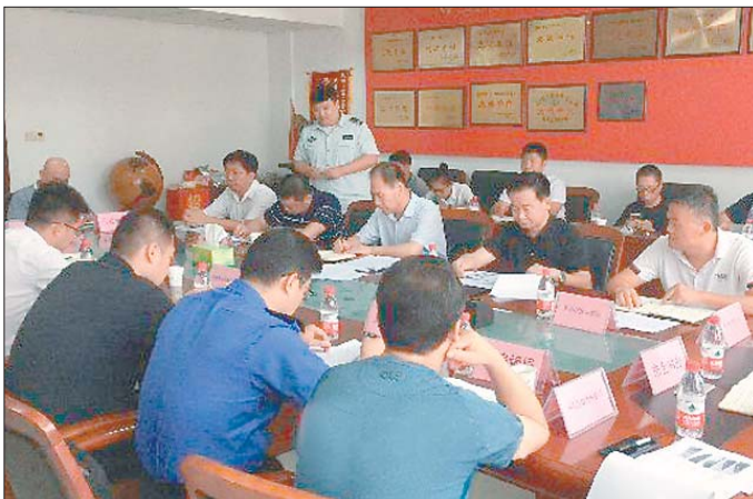
海尔全运村召开“拆违拆临”实施联合惩戒措施协调会。

园南区上述14户违建业主进行联合惩戒。 另外,在近期工作巡查中,龙洞街道办事处城管委发现海尔绿城全运村玺园、御园部分业主存在擅自挖掘、扩建地下室的违法情况,城管委立即介入调查并全部下达停工通知。 其中,2018年5月9日,龙洞街道办事处驻海尔绿城全运村违法建设专项整治工作组,向玺园15户、御园1户违建业主下达了《关于拆除海尔绿城全运村社区违法建设的通告》。并在5月中旬再次向15家违建业主下达《关于海尔绿城全运村玺园别墅区违法擅自挖掘、扩建地下室的业主立即停止施工并恢复原貌的意见》。 截至目前,玺园15户以及御园1户违建业主未按照海尔绿城全运村违法建设专项整治工作组的通知要求进行恢复。由于玺园违建情况严重,不仅损害了园区业主的合法利益,而且在拆违拆临的大形势下,顶风而上,性质极为恶劣。因此,海尔绿城全运村社区违法建设专项整治工作组表示,对海尔绿城全运村玺园15户以及御园1户违建业主进行联合惩戒。 “主要包括金融办、房管局等10部门的联合惩戒,对拒不拆除的业户家中实施断电断水等措施,直至违建拆除。”专项整治工作组相关负责人表示。