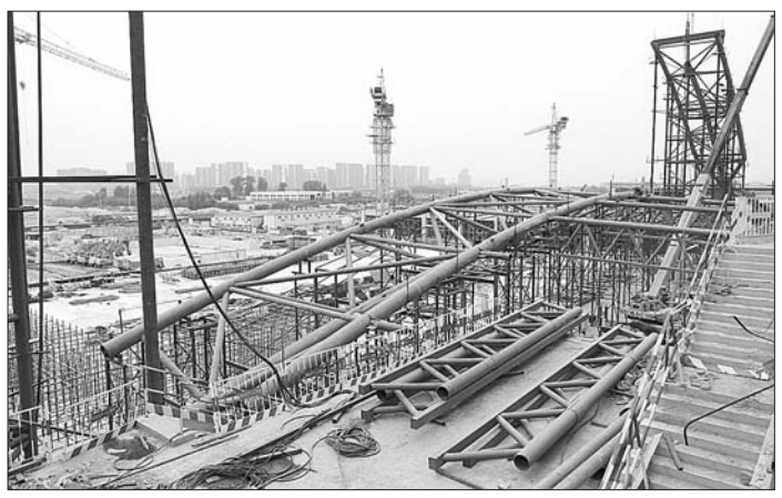
正在紧张施工的新东南站南广场。

“未来这里就是旅客进出中央站房的主要通道。”张坤介绍,南广场两侧都是BRT车场,下面就是地铁R3线。据悉,R3线济南新东站的站点就在南广场,目前