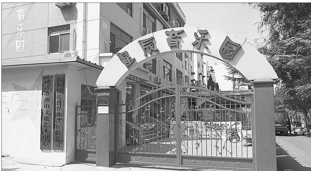
星辰育乐园已经停止教学活动。

“现在已经不上课了，有的老师已经离职了。”星辰育乐园一位老师说，由于他们已经被拖欠了3个月的工资，有些老师已经离职，