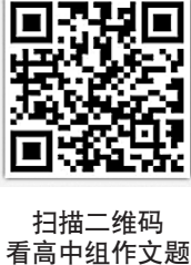
扫描二维码 看高中组作文题

“写作,绝不止有技巧与优美的词藻,其实书写的过程就是一种美妙的体验,它能够帮助同学们更细致的观察、感受、思考生活与整个世界。”台湾联合报系相关命题专家表示,借助这样的话题,既引导学生关注时代脉动,也能思新兴产业对于自身与人类的影响,同时,启学生思考,善用各种材料,组织理解,具体表达自己对电竞议题的见解与想,借此考验学生抒情意、理性论述的语言能力。