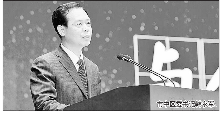
市中区委书记韩永军。