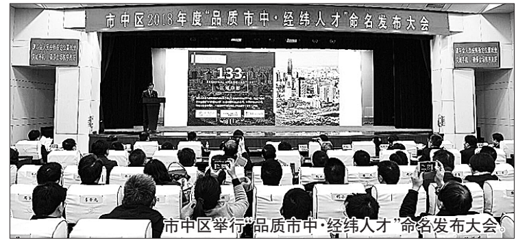
市中区举行“品质市中·经纬人才”命名发布大会。

政,明确“品质市中·经纬人才”计划评选奖励办法基础上,市中将继续学习借鉴各地特殊招才经验,制定完善人才政策实施效果评估机制和动态调整机制,将人才安居、子女入学、医疗保健等支持举措纳入配套细则。此外,市中区将发挥招才引智大使与海外人才工作站的推介宣传作用,举办好中国(济南)国际数字经济高峰论坛等活动,努力引进一批诺奖级、院士级科学家与国家级科技人才、产业领军人才,实现人才数量、