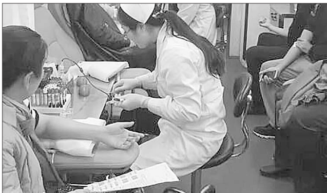
省血液中心鼓励更多的市民前来献血。

近几天,街头每日献血人数不足百人,而作为医疗资源较为丰富的省城济南,每天至少需要300人献血才能基本保证临床用血需求,加之节前择期手术人数增多,导致血液库存短时间呈持续下降趋势。目前,省血液中心库存量不足7天,血液库存急待补充。