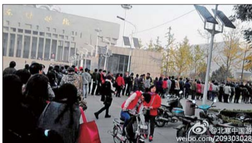
▼@北寒中国游：真恐怖，为了看个达芬奇自画像，地处济南的山东省博物馆前排了得有三十千米的长队，数万人之巨。晕死。目前队伍还在继续增加中。