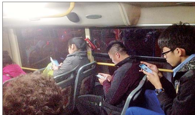
@摄影师海涛：知道现代人的颈椎为啥都不好？主要是因为公交车太颠了！我从19:00上车到现在，他们都一动不动地低头看了半个小时了！包括我，全车人都在低头看手机！ @梦碎江南-坤：换个原始版的诺基亚，问题不就解决了？