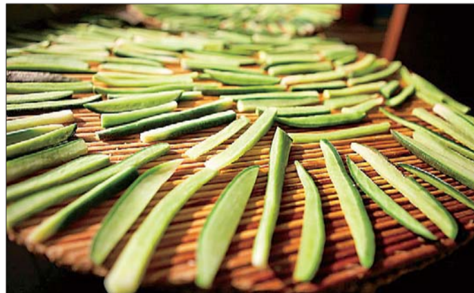
@SUN山：秋冬时节，老济南有腌萝卜的习惯。把新鲜的萝卜洗净之后切成条，用盐腌制后，晾上一星期左右，半干时搓上五香面、辣椒面，颜色好看，吃起来也有嚼头。另外还有用酱油腌制的，酱油腌出来的萝卜颜色发黑，吃起来比较脆。