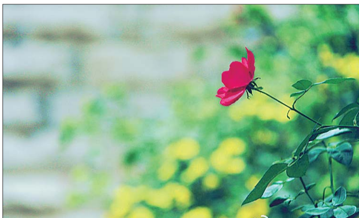
►@摄影家初冬暖阳：季节已深秋，你还依然美丽，只为等我遇见你。摄于山东大学趵突泉校区。