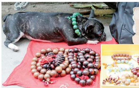
▲@黄伟民8：狗狗帮着看摊，不用问，这个狗狗和摊位是同一个主人滴。