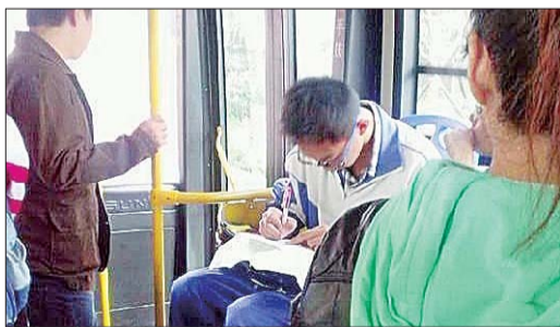
▲@幸福小猫不吃鱼：朋友拍的，这孩子有多爱学习。