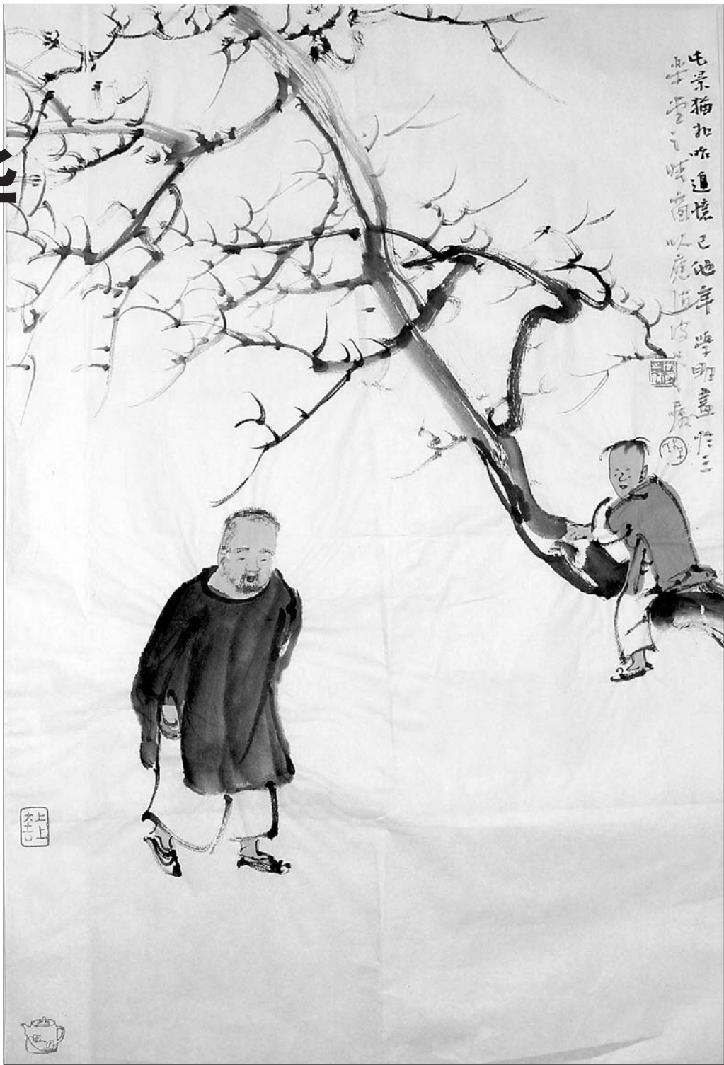
著名书画家李学明先生为跋语题画

是为跋——却突然看见去世多年的外公；他的身影如此清晰——仿佛，幼年的我，骑在外婆家那棵歪脖子老枣树上，看见微醺的老人家从大队部归来，虽然离开了扩音器，却依然唱着京剧——那悠扬的唱腔，如今才知道，颇有程派低沉、暗哑的韵味。于是，一帧趣味盎然的老画浮现脑海，遂邀擅绘老叟童子的著名书画家、山东省美术家协会副主席、山东工艺美术学院李学明教授为跋语题图，复邀著名书法家、北京书协协会副主席、首都师范大学中国书法文化研究院院长、博士生导师刘守安教授为本书题签。感谢二位先生提携我，感谢他们给本书添一段佳话，增几分雅趣！