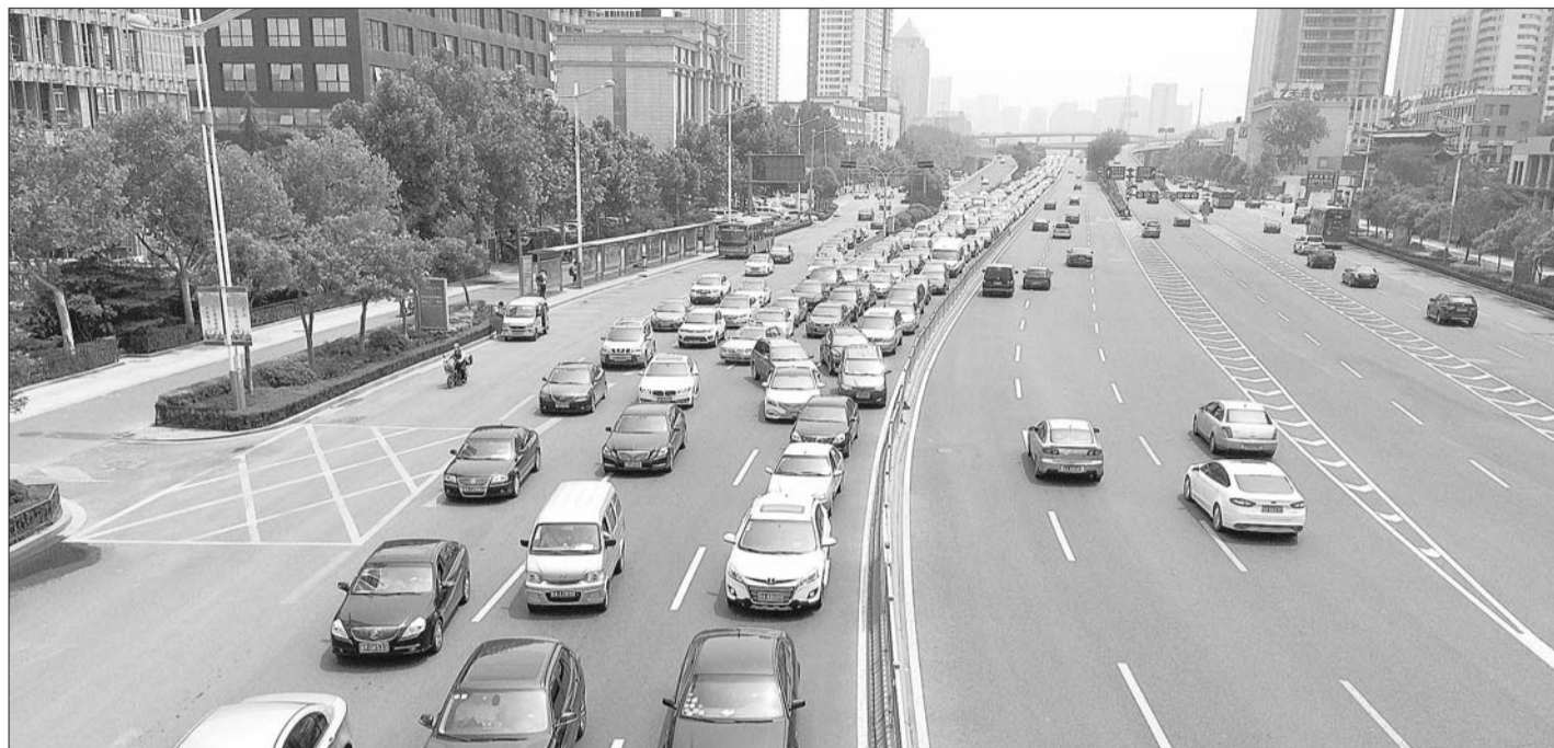
燕山立交桥附近近期比较拥堵。

另外还有个不得不提的致堵因素,便是接二连三的道路施工工程,不论是前段时期的经十路危旧燃气管道改造,还是二环东路高架南延,都在很大程度上加剧了燕山立交桥拥堵。