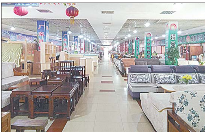
商城业主尚未接到明确的拆违通知。