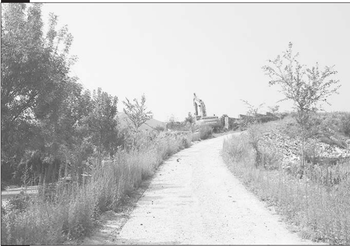
事发地点的生产路坡道。