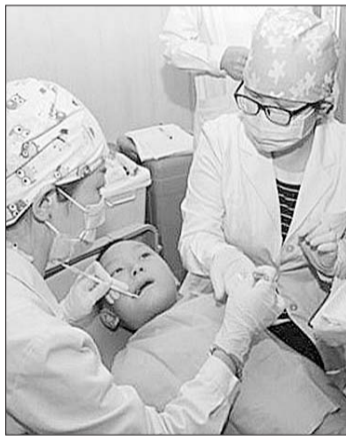
可恩口腔医生为村中适龄儿童进行免费窝沟封闭。

出席启动仪式的济南人民警察职业学院政委李立东发言指出,口腔保健对身体健康极为重要,地方政府与企业应积极响应世界卫生组织提出的“8020计划”,做好群众的口