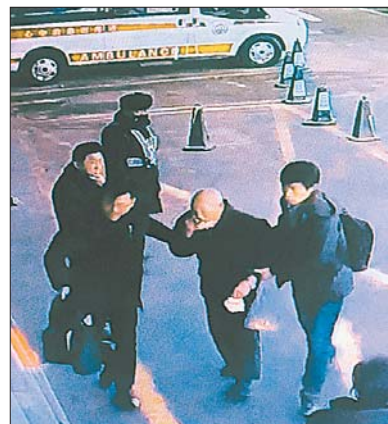
两名好心人扶起老人。 视频截图

如果您认识这两名2月26日上午在省千佛山医院门前过街天桥上救人的好心人,请拨打电话0531-85193939联系我们!