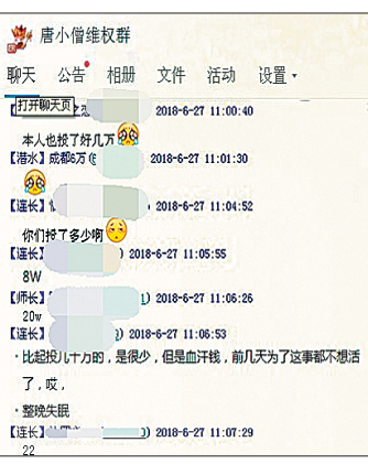
投资者成立维权群。

另据《每日经济新闻》报道，唐小僧平台6月中旬就已关停，其高管于6月16日上午主动找到上海经侦报案，公司营业场所已被警方封锁。