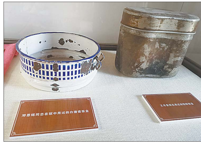
旧址内陈列着王尽美、邓恩铭使用过的饭盒。