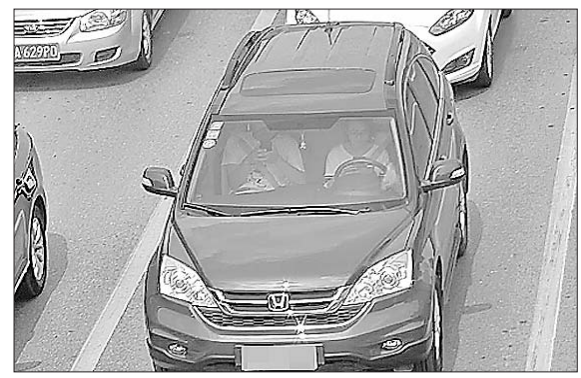
7月7日,工业南路开拓路路口,一名司机驾车时低头操作手机。

在你眼中只有手机,看不到路面交警的时候,空中的电子眼正在看着开车玩手机的你。从7月1日到7月16日,济南交警共抓拍分心驾驶行为1.7万起。济南交警提醒,开车时请勿接打电话,吸烟、饮食等。