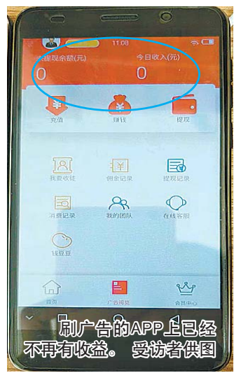
刷广告的APP上已经不再有收益。