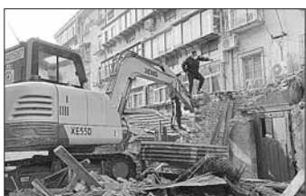
拆除现场。