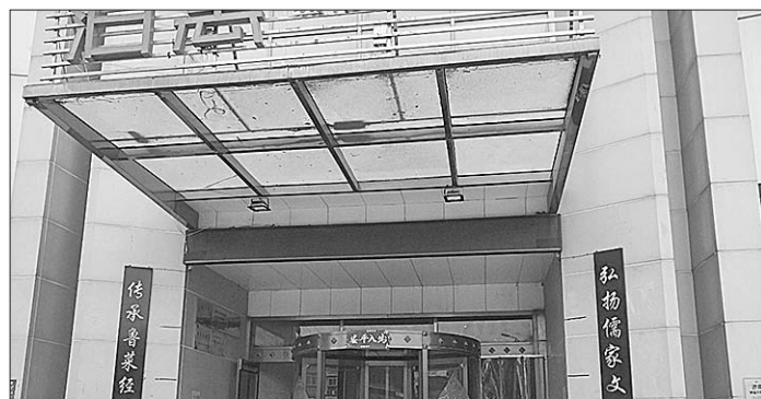
被消费者举报的饭店。

3月29日,生活日报记者以预订包间的方式进行暗访,服务人员称在包间吃饭最低消费600元,里面包括酒水等。然而,当记者表明身份以后,该饭店的工作