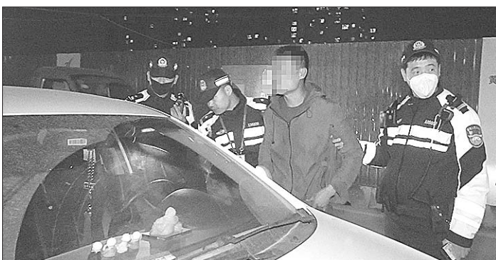
男子驾照吊销五年依然酒后驾车。

第二辆白色轿车被拦停以后,涉嫌酒后驾驶的司机没有出示自己的驾驶证,而是让坐在副驾驶座上的妻子拿证件。“天太黑了,我不放心妻子开车。”第二辆白色轿车司机说,这辆白色轿车是他替妻子提的车,他担心妻子作为新手开夜路很危险,就