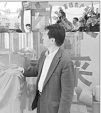
会后,与会领导、专家分别在唐王丰收家庭农场、董家馥羽草莓专业合作社举行工作站揭牌。

记者了解到,功能农业是高效农业,而富硒农业是功能农业中发展较快的部分。富硒农产品因具有多种优越的功能,越来越得到广大消费者的认可和市场的青睐。此次讲座邀请国内外专家分享经验,总结分析,进一步突破农业科技创新的瓶颈,实现资金、技术、生产、加工等资源的整合,为历城的特色农业实现高质量发展和农民增收致富做出贡献,促进山东富硒产业未来五年11723工程的快速有序、健康持续发展。