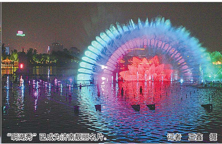
“明湖秀”已成为济南靓丽名片。