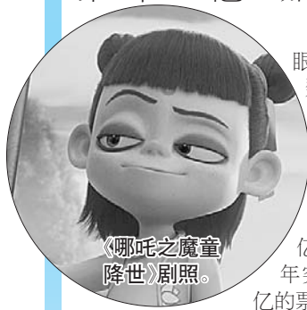
《哪吒之魔童降世》剧照。

据猫眼专业版数据显示，2019年内地票房在8月9日突破400亿，比去年突破400亿的票房节点(8月5日)要慢4天。今年收获300亿票房的时间点是近一个半月前的6月23日——这个速度比去年突破300亿晚了一周，当时的时间点是2018年6月16日。