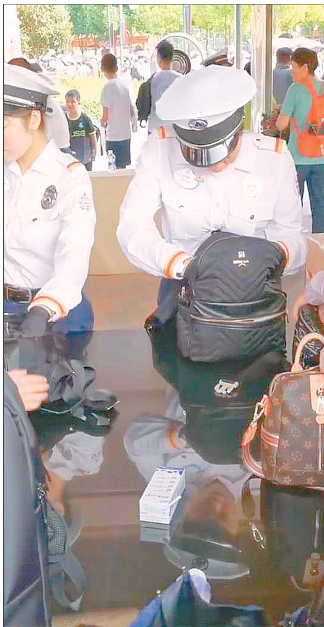
上海迪士尼的工作人员正对游客开包检查。资料片

记者还了解到,长隆集团旗下主题乐园、华强方特旗下个别乐园也存在“翻包”、“禁带食品”的类似规定。对迪士尼的新做法,长隆方面表态会“研究研究”。