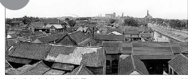
西门外东流水街一带民居。