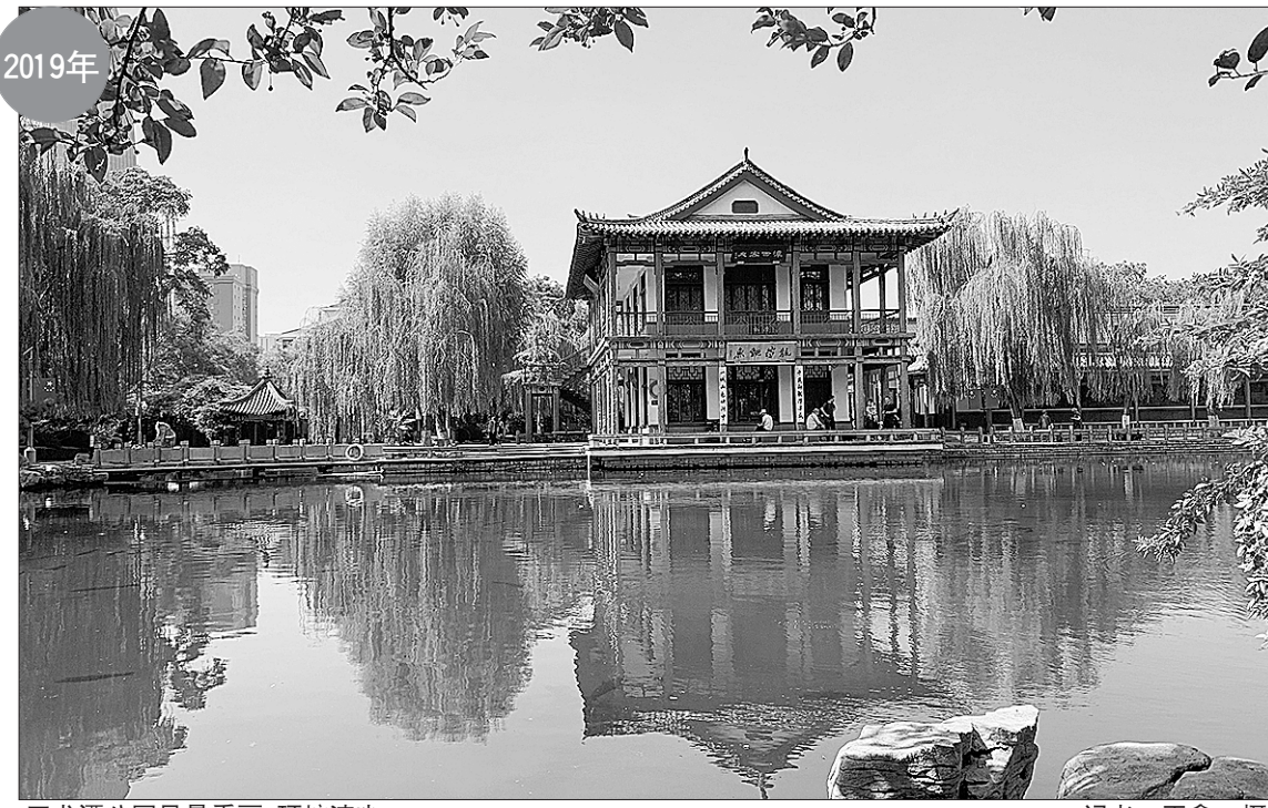
五龙潭公园风景秀丽,环境清幽。

江家池子街位于共青团路(估衣市街)北侧,五龙潭南侧,为东西走向,此街虽然只有百十米,却有天镜泉、醴泉、赤泉、金泉、东蜜脂泉等名泉,还有老字号汇泉楼饭店、醴泉居酱园,至今被老济南人津津乐道。五龙潭公园最初建成