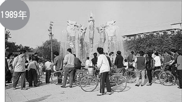
五龙石雕吸引了不少市民驻足观看。

当年10月16日,中国自行制造的第一颗原子弹在新疆罗布泊爆炸成功。为纪念这件大事,济南市对月牙泉泉池进行扩修改造,池长13米,宽8米,水深1.5米,水中立有高3米的蘑菇云石,由山石堆叠而成,将泉水引上石顶再喷出,形成“月牙飞瀑”景观。