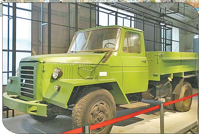
▲企业当年生产的五吨载重车。

济南市的莱芜区是革命老区,莱芜战役闻名于世。在战争年代,莱芜人民作出了巨大贡献。在新中国成立后,当我国同时面对苏美两大超级大国战争威胁时,这里又成了山东省“小三线”军工企业的重要承载地。除了之前探访过的“709”山东人民印刷厂,莱芜区境内还有一家“小三线”军工企业,那就是1966年迁建于此的“山东省交通厅汽车修理厂”,俗称“17号厂”。现在,位于莱芜区高庄街道办事处老君堂村以北、占地面积307亩的汽车修理厂旧址,已经较为完整地保存下来。其中,具有强烈时代特征,建筑面积达34800平方米的车间厂房和办公楼等配套建筑,大部分保存完好。更为可喜的是,由于莱芜区委区政府的高度重视,莱芜区属国企山东赢泰文化旅游发展有限公司已经介入这片难得的工业遗产,计划投资15亿元,利用原有建筑厂房,对厂区内具有修复价值的生产车间及各类配套建筑进行修复,计划建设一处集汽车工业博物馆、工业遗迹旅游、亲子教育等为一体的红色文旅综合体。