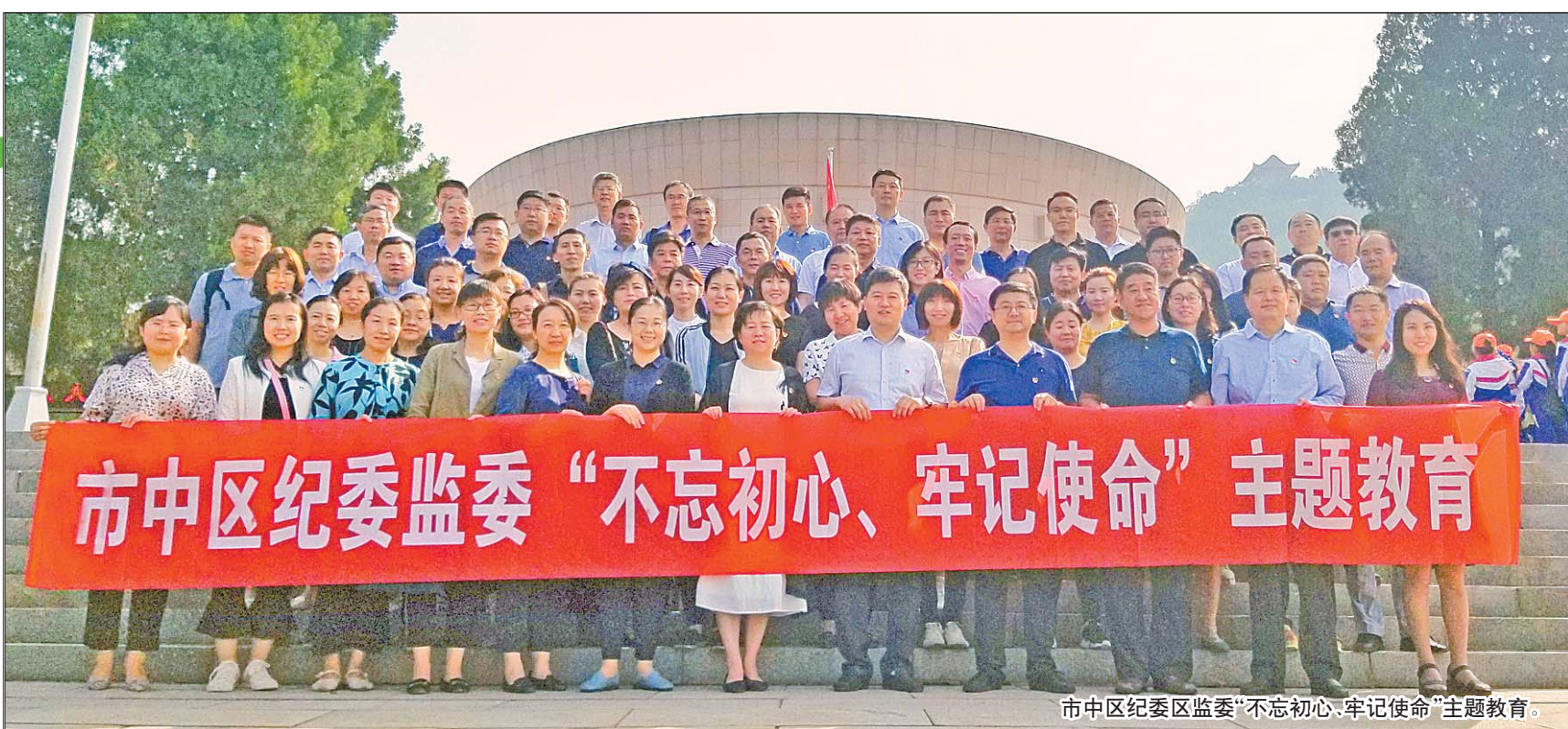
市中区纪委区监委“不忘初心、牢记使命”主题教育。