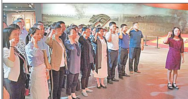
市中区纪委区监委机关党员到济南战役纪念馆接受革命传统教育在党旗前庄严宣誓。

2019年以来,市中区纪委区监委在市纪委市监委和区委的坚强领导下,坚守政治机关定位,实施“1+453”工作思路,忠实履职尽责,积极担当作为,狠抓工作落实,着力推动纪检监察工作高质量发展,各项业务工作迈出新步伐、取得新成效。