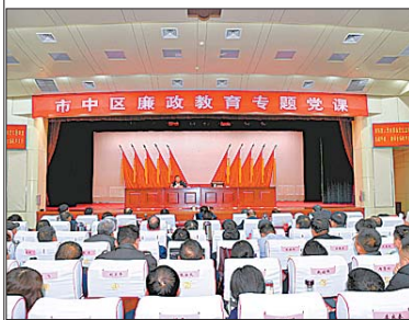
市中区召开廉政教育专题党课。