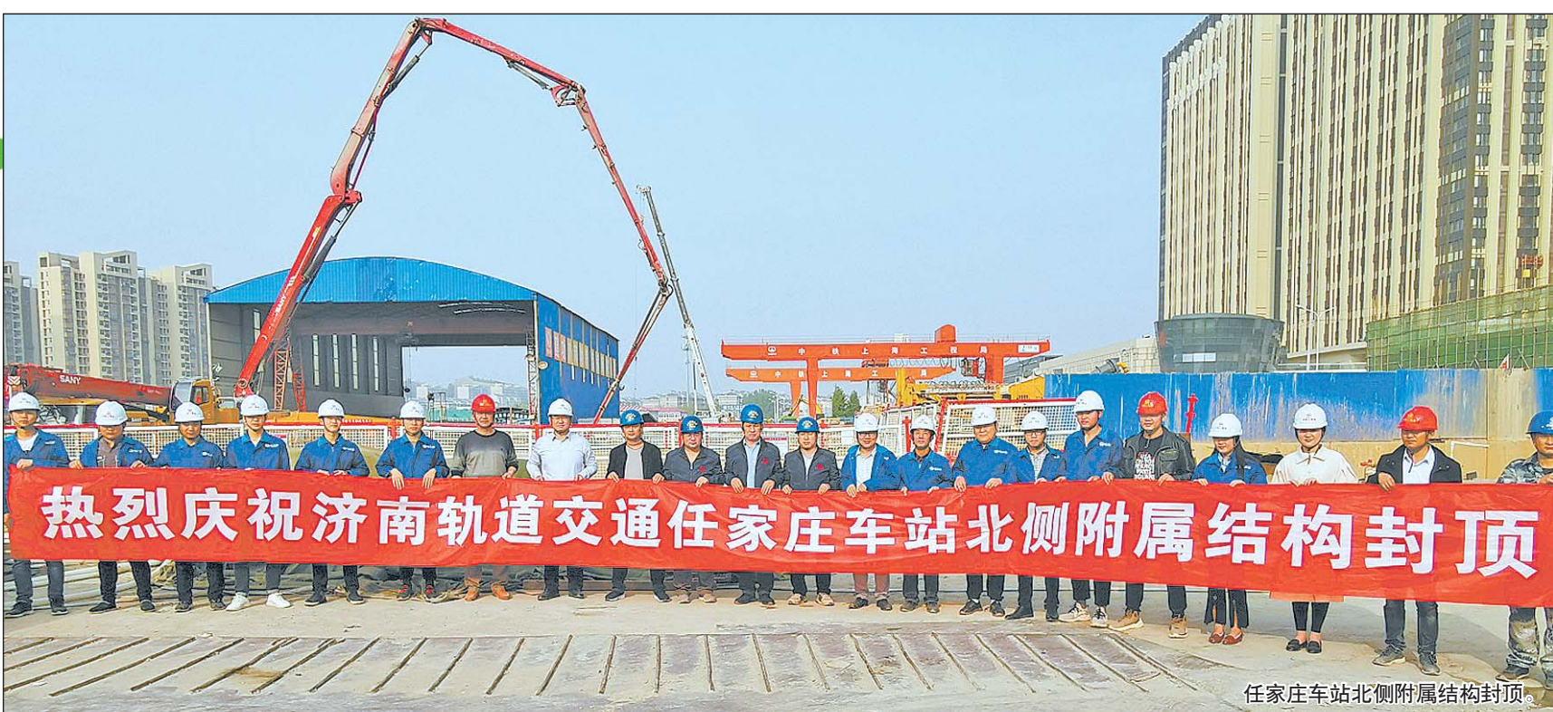
任家庄车站北侧附属结构封顶。