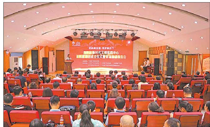
新时代文明实践中心百姓宣讲团。