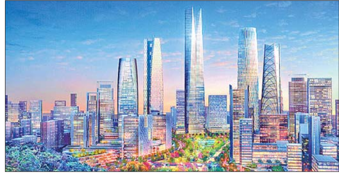
国际金融中心产业金融片区效果图。