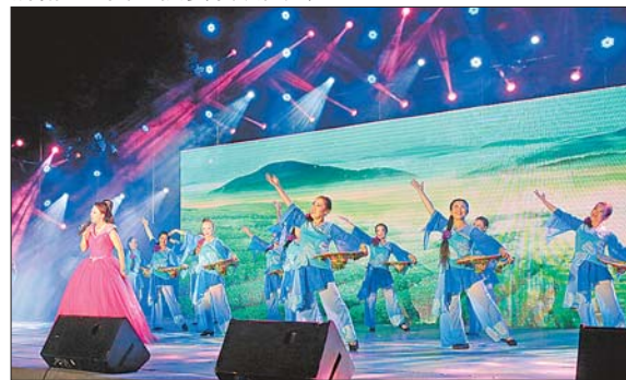
丰富多彩的群众文化生活。