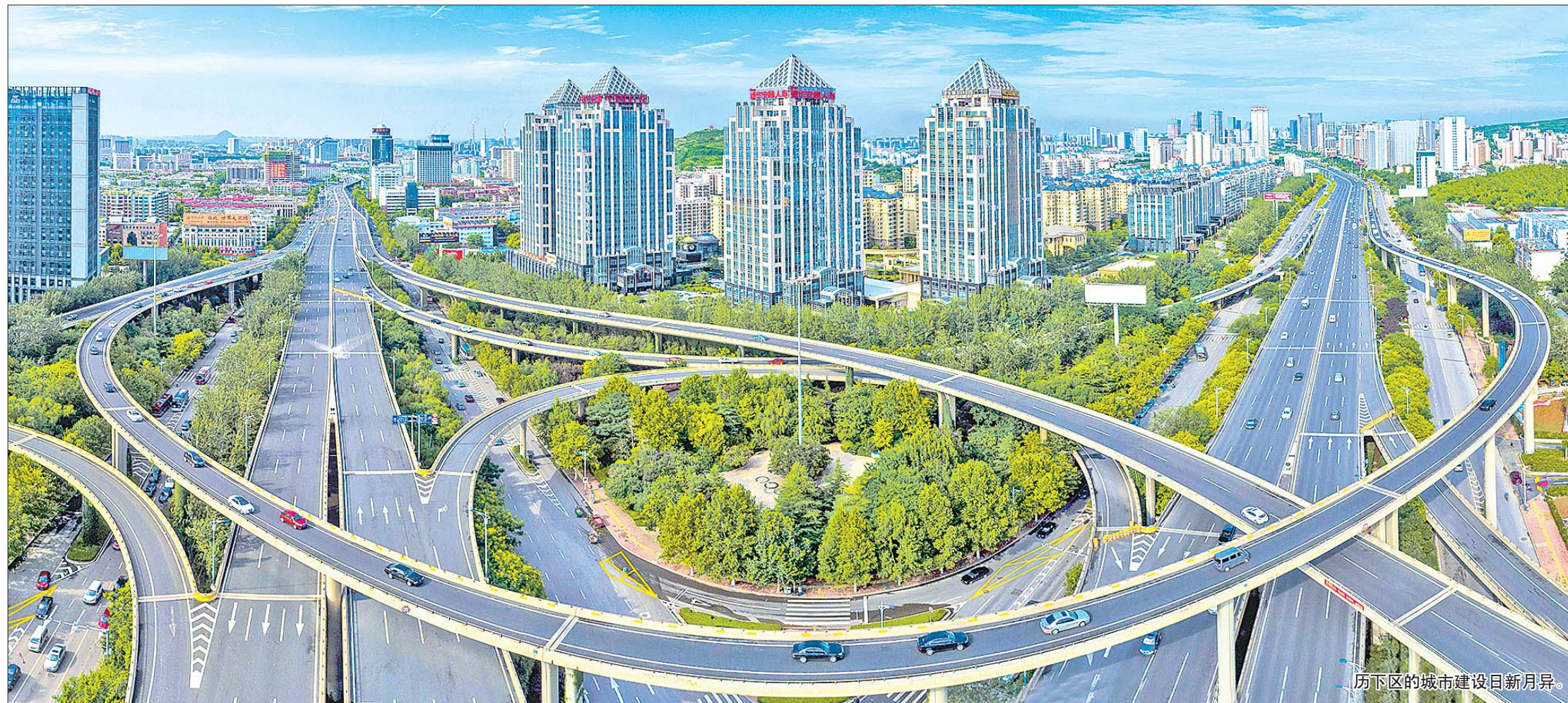
历下区的城市建设日新月异。