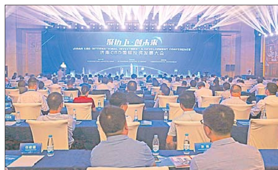
济南CBD国际投资发展大会。

支撑发展的动力更加充沛。八大百亿级产业蓬勃发展,产业金融、商贸流通两大产业集群向千亿级迈进,全区金融机构总数达700余家,实现金融业增加值超过350亿元,占全市总量的40%以上;总部经济更加聚集,市级认定总部企业达42家,占到全市的三分之一,全区“亿元楼”达33座、“月亿楼”3座。