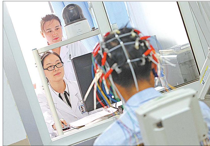
山东省立医院神经内科拥有先进的临床检查及科研仪器设备,更好助力精准化诊疗。

每个人忙碌并快乐着。 步入省立医院神经内科,也恰恰如这群最可爱的人所打造的那样:温馨的环境,温暖的医患关系,和谐的团队协作、创新的发展理念……这里是患者的家,这里也是神经内科所有医务人员的家。 且持梦笔书奇景,日破云涛万里红。放眼未来,山东省立医院神经内科将继续秉承“人才、创新、品牌、规范化”的发展理念,深化亚专业发展内涵,不断提升临床终极诊疗能力和学科核心竞争力,为我国神经病学事业的发展壮大和山东省立医院打造“与国际接轨的国家级名院”输送动能、贡献力量。