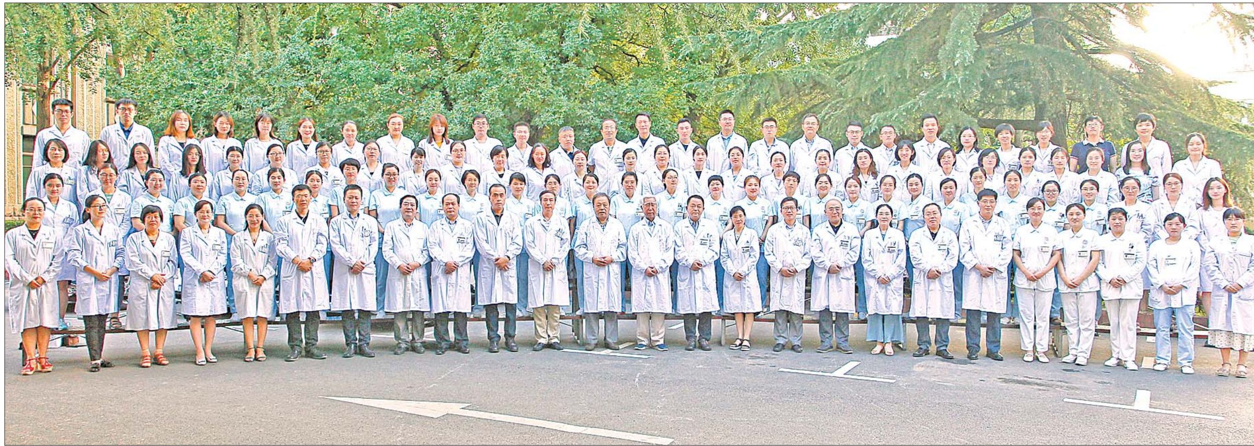
山东省立医院神经内科现有113人,其中中医56人,高级职称以上人员22名,医护人员中拥有博士学位者38名。